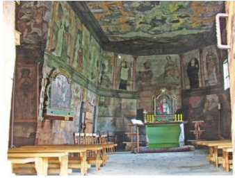
Felső- és Alsólápos