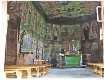
Felső- és Alsólápos