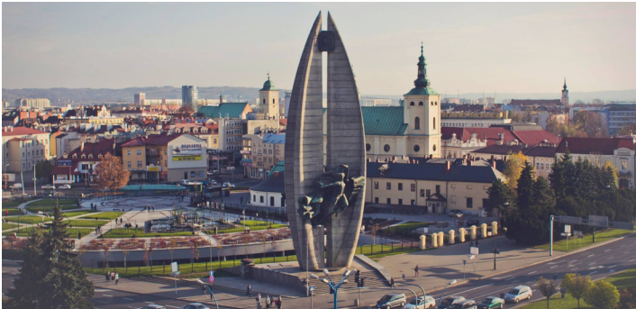
a Lubomirski család nyári kastélyát